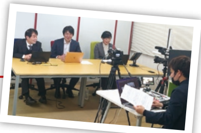
和やかな雰囲気の中にも緊張感が伝わります